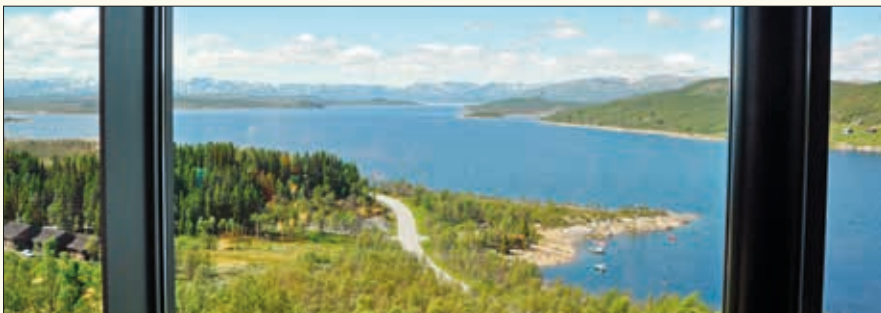
Ingen kan klage på utsikten fra restauranten på Hardangervidda nasjonalparksenter!