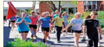
Klar til KonfKamp. Her skal rødt lag forsvare sitt territorium.