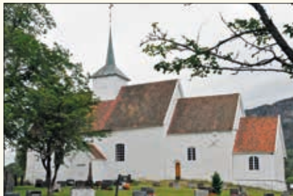
Sauherad kyrkje sett frå sør.