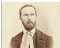
Aasmund Olavsson Vinje

I år er det 200 år siden Aasmund Olavsson Vinje ble født. Olav Nordstoga forteller om dikteren. Ellen Bojer Nordstoga synger tekster av Vinje.