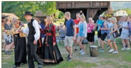
Skikkelig polonese hører med.