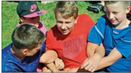
En konfirmantleir skaper tette bånd mellom mennesker.