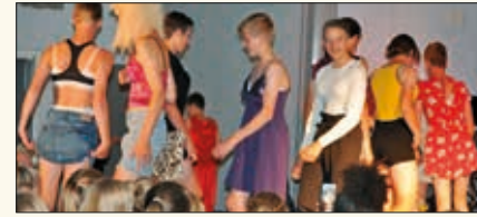
To kvelder var det underholdning. Her er det en meget fantasifull moteoppvisning.