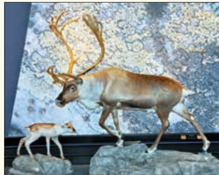
Mye på Hardangervidda nasjonalparksenter dreier seg om villreinstammen på vidda. Dette var det nærmeste vi kom reinen.