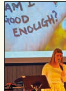
Lene hadde to undervisningsbolker, om menneskesyn og om selvbilde.