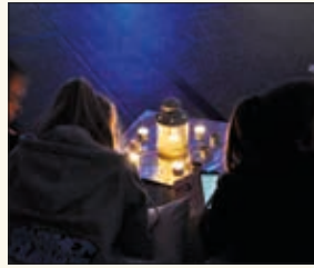
Hver kveld var det skumringsstund, en rolig samling rundt tente lys.