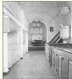
Bilete tekne av Sauherad kyrkje 1909. Bileta har same motiv som i Jon Ingebretsens seroppgåve, men nokre av dei er tatt på nytt for å få fargebilete.