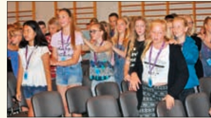
Sang var et viktig innslag på alle fellessamlingene. Her er det en sang som oppfordrer til Walking in the light of God.