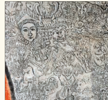
Frå koret i kyrkja.

Sauherad kyrkje er vigd til S. Laurentius, ein romersk diakon som leid mar-