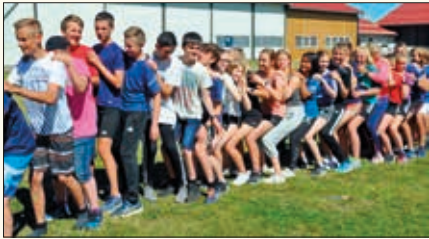
Når så mange konfirmanter skal være sammen på leir er det nødvendig å leve tett på hverandre.