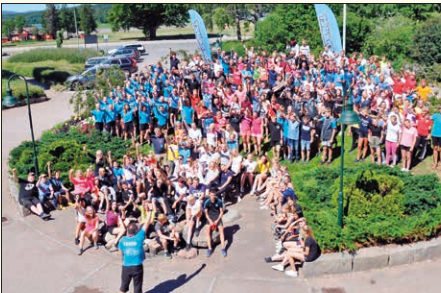
Hele leiren samlet.