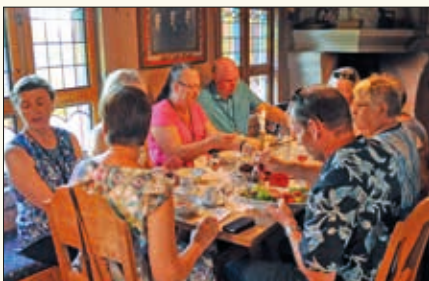
Rømmegraut, spekemat, flatbrød og lefse, - kan det bli norskere?