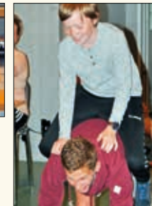
Jesus red inn i Jerusalem på et esel.