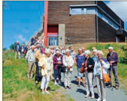
Forsamlingen utenfor Hardangervidda nasjonalparksenter.