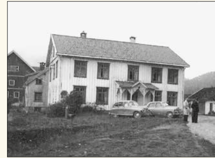
Hovedbygningen på prestegården.

I skifteprotokollen frå skifte på Klevar 18. april 1825 kan ein sjå at skifteretten lyste kyrkja ut på auksjon. Sjølv om kyrkja blei utropa tri gonger, kom det