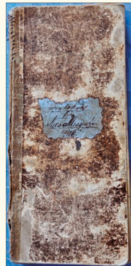
Protokollen fra 1880.

neforeningen en underforening av hovedforeningen. De hadde egne møter, men sendte kollekten til hovedforeningen.