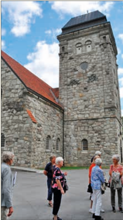
Rjukan kirke har en lang og til tider dramatisk historien. Blant annet var det en stor brann i forbindelse med innspillingen av filmen «Helter fra Telemark» på 1960-tallet.