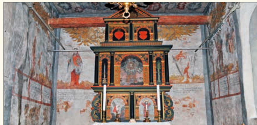
Koret og altertavla.

Den målinga som i det siste er avdekt på den gamle altertavla og i loftet og