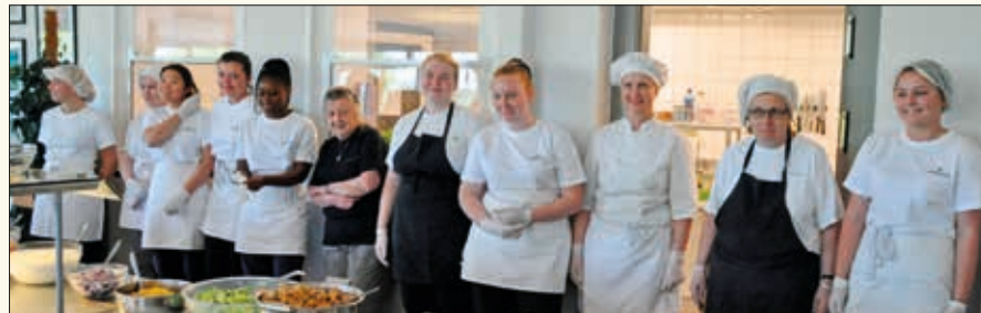
Maten på Gjennestad er helt fantastisk, velsmakende og nydelig presentert. Kjøkkengjengen gjør en strålende innsats.