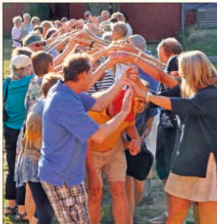
Om polonese er vanlig i USA vites ikke, men det skapte stor lykke på Eøju.