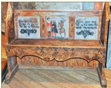
Brudestolen i Sauherad kyrkje.