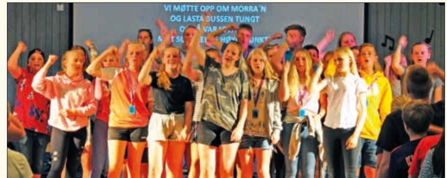
Mange ville være med i forsangerkoret når leirsangen skulle synges.