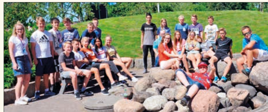
Konfirmantene fra Sauherad og Nes samlet til leir på Gjennestad videregående skole i Stokke i Vestfold. De to konfirmantene til høyre på bildet er fra Bø.

Alle de 21 konfirmantene kommende vinter i Sauherad og Nes var med på konfirmantleiren på Gjennestad videregående skole i Stokke i Vestfold i slutten av juni. Men de var ikke alene! Vel 200 konfirmanter fra Tokke, Vinje, Kviteseid, Hjartdal og Notodden fylte den tidligere gartnerskolen med mye liv og noe røre.